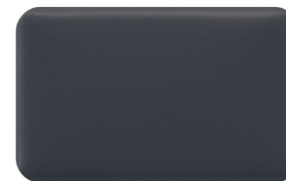
7016 Anthracite Grey